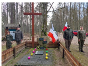
Pamiętamy o polskich bohaterach w Narodowy Dzień Pamięci Żołnierzy Wyklętych