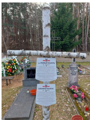
Pamiętamy o polskich bohaterach w Narodowy Dzień Pamięci Żołnierzy Wyklętych