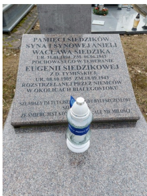
Pamiętamy o polskich bohaterach w Narodowy Dzień Pamięci Żołnierzy Wyklętych