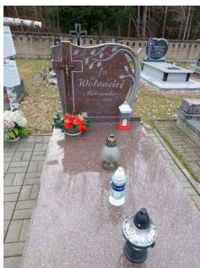
Pamiętamy o polskich bohaterach w Narodowy Dzień Pamięci Żołnierzy Wyklętych, fot. B. Łabędzki