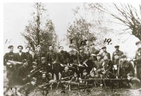
2 szwadron 6. Brygady Wileńskiej, maj 1947