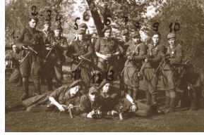
Żołnierze I Brygady Podlaskiej NZW, maj 1947