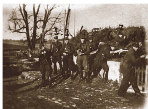
Żołnierze z oddziału PAS NZW wach. NN „Stalowego”