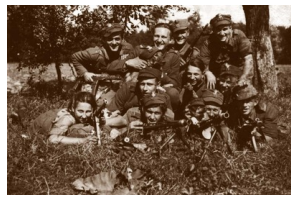
Żołnierze 5. Brygady Wileńskiej, lato 1945