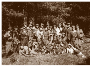
Żołnierze 5. Brygady Wileńskiej, lato 1945

https://ipn.gov.pl/pl/publikacje/ksiazki/13179,Śladami-zbrodni-okresu-stalinowskiego-w-wojewodztwie-bialostockim.html