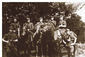
Zwiad konny 3. Brygady Wileńskiej NZW